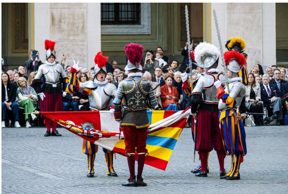
Vereidigung der Gardisten.