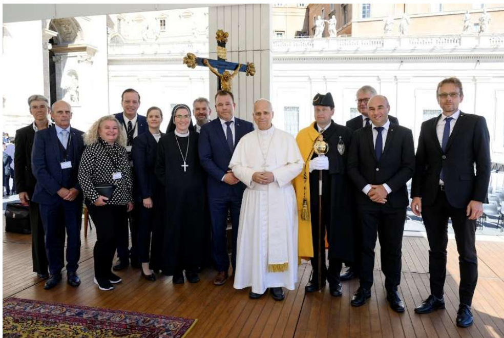
Papst Leo XIV. mit Urner Regierung und Vertretung der Landeskirche.

Der Kleine Landeskirchenrat traf sich im Jahr 2025 zu neun Sitzungen. Wichtige Themen sind die Zukunft der Kirche im Kanton Uri und die richtige Struktur, um den Bedürfnissen der Zukunft zu begegnen. In diesem Zusammenhang wurde ein Vorschlag für eine angepasste Verfassung der Landeskirche erarbeitet. Höhepunkt war die Teilnahme des Kantons Uri an der Vereidigung der Schweizergarde, die aufgrund des Konklaves im Mai ausnahmsweise am 4. Oktober stattfand. Diese ermöglichte neben vielen Begegnungen mit Gardisten auch, den Auftritten von zwei Urner Jodelchören im Petersdom und am Petersplatz auch persönliche Begegnungen mit Papst Leo.